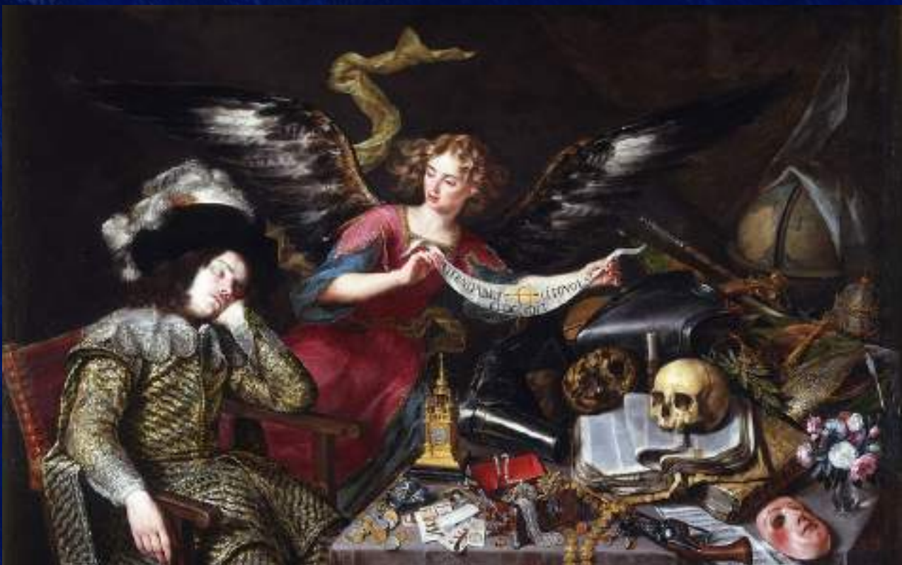
El Sueño del caballero, Antonio de Pereda (1611-1678)