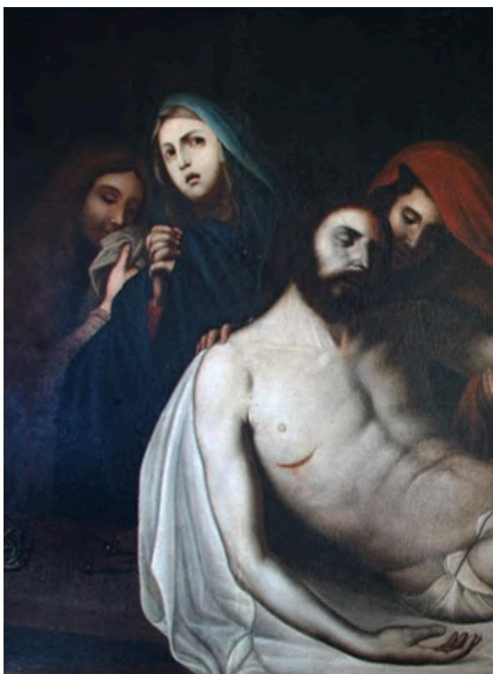
« Enterrement du Christ », d'après Ribera (détail) Mariana de la Cueva Benavides y Barradas (1623- 1688)

Œuvres vocales sacrées pour soprano, deux violons et basse continue de six religieuses baroques italiennes