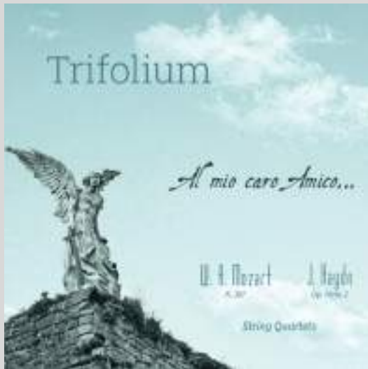
W. A. Mozart – J. Haydn: Cuartetos de cuerda