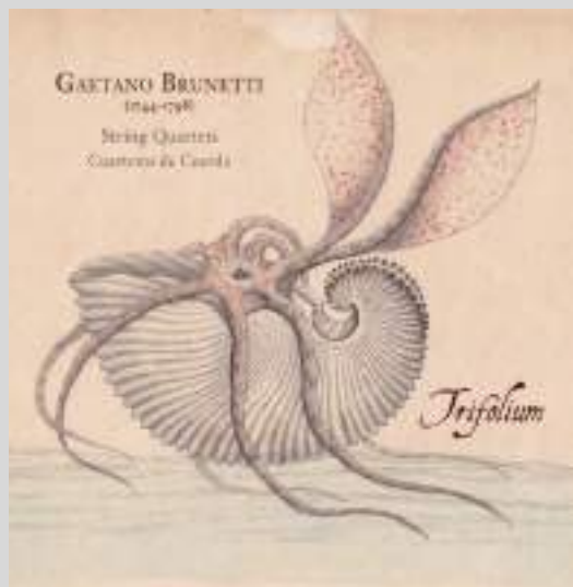
Gaetano Brunetti: Cuartetos de cuerda