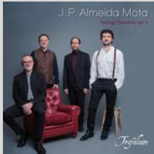
J. P. Almeida Mota: Cuartetos de cuerda Op. 4